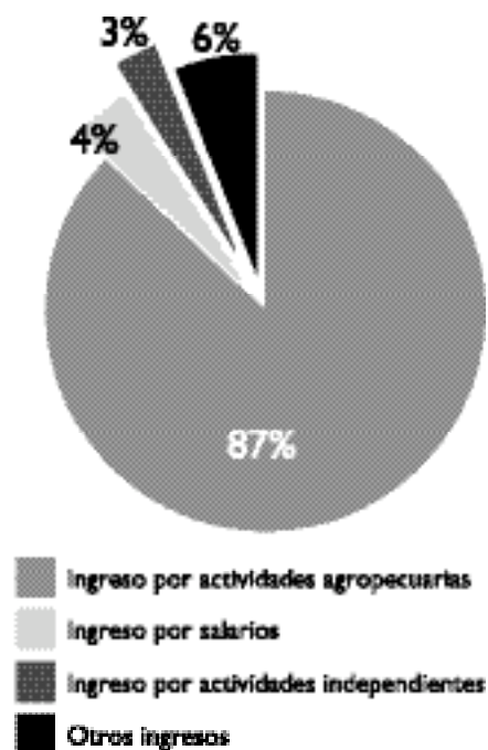
Cuadro No. 3 Composición de los ingresos familiares para familias cuya primera fuente de ingresos son los ingresos agropecuarios

Es muy importante también notar que pese al alto grado de diversificación de los ingresos familiares rurales, cerca del 50% de esas familias, que además tienen los más bajos niveles de ingresos del área rural, siguen teniendo como fuente principal los ingresos agropecuarios. Los resultados observados para el año 2002 demuestran que, en promedio, el 80% de los ingresos familiares de estas familias provienen de sus actividades agropecuarias familiares (Gráfico No. 3). Es decir, tienen una fuerte dependencia sobre la producción agropecuaria familiar. En general, estas cifras revelan que en Bolivia la “especialización agropecuaria” es todavía predominante, pero aparentemente no es la más rentable alternativa.