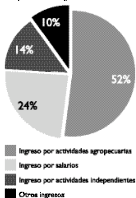
Cuadro No. 1 La composición de ingresos rurales