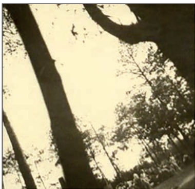
Una de las cuatro fotografías que quedan como único registro fotográfico de Auschwitz.

Al margen del documental, una puesta de este tipo es justamente el memorable libro de Didi-Huberman Imágenes pese a todo . Un momento especialmente revelador para hacer palpable lo que llamo fijación indicial en referencia a una de las cuatro fotografías que sobrevivieron de Auschwitz es el siguiente: