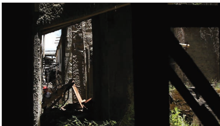
Fotograma de La Siberia : un antiguo trabajador busca el camino de salida de uno de los espacios.

Esta dualidad de su relación con el espacio dio forma a la estructura narrativa del documental durante el proceso de edición. Las dos grandes partes del documental están marcadas por esos dos estados anímicos: el entusiasmo ante los restos que desde la nostalgia “reviven” La Siberia, por una parte, y la desilusión ante la constatación de la ausencia y la lenta disolución del “artificio” de la memoria hacia el final del documental, por la otra.