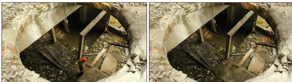
Fotogramas en secuencia de La Siberia .

Esta acción también juega un papel determinante en la narrativa porque el documental se inicia con la entrada de los personajes al espacio y finaliza con su salida. Al mismo tiempo, ese dispositivo lo usamos en el recurso visual en planos en los cuales los personajes cruzan fugazmente la ruina, sugiriendo en el montaje el estatus paradójico, fantasmal si se quiere, de su presencia en el espacio: su presencia en él es inestable, suspendida entre presente y pasado.