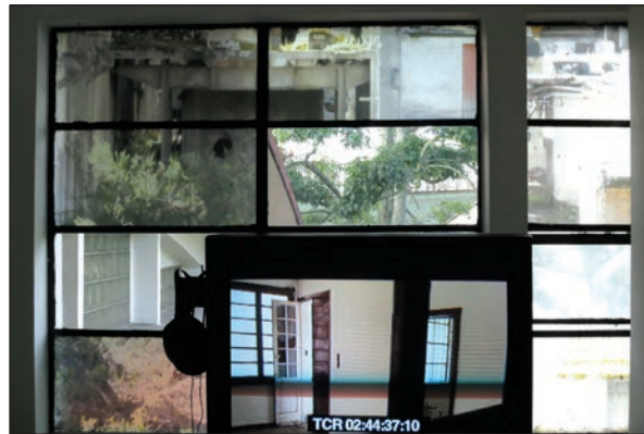
Imagen de la videoinstalación La Siberia: recuerda al olvidar . Pantalla con material de archivo sobre un mosaico de ventanas, algunas con transparencias impresas de imágenes de la ruina.

La dimensión del archivo materializa la monumentalidad de los olvidos del documental y evidencia las paradojas del acto de recordar: el archivo es un mosaico caótico de sentidos, inenarrable, a diferencia del documental. Por otra parte, en contraste con ese afán narrativo, estas pantallas hacen más evidente el registro de la fragilidad de la memoria: recuerdos contingentes, así como también silencios, repeticiones y olvidos de nuestros personajes.