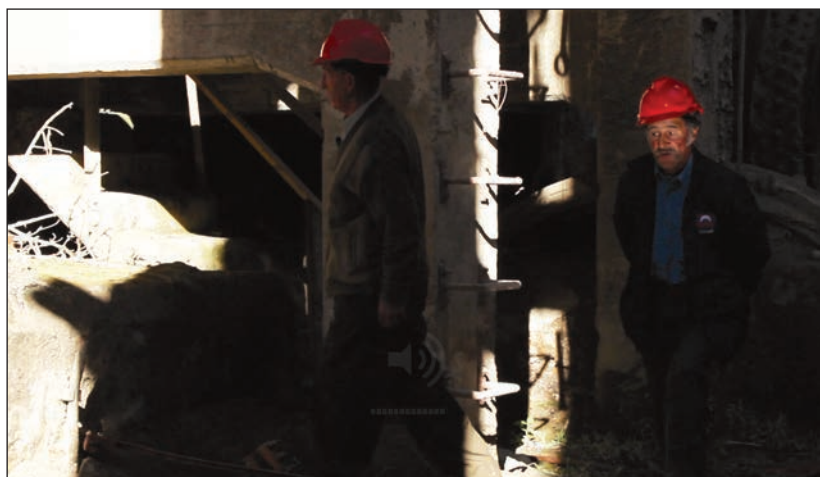
Fotograma de La Siberia : dos personajes caminando por un claroscuro al interior de las ruinas.

En consecuencia, me pareció necesario formular el concepto de representación claroscuro , el cual es un intento por aprehender el movimiento pendulante entre la iconoclasia y el realismo que subyace en el corazón de las complejidades de la representación del pasado. La defino como una representación con la cualidad de evidenciar sus propios límites: el hecho de que recordar implica olvidar. Así, involucra cierto nivel de reflexividad, pues implica una proposición de segundo orden referente a la fragilidad que es propia de la representación del pasado, lo que permite así salvaguardar un equilibrio entre la iconoclasia y el realismo.