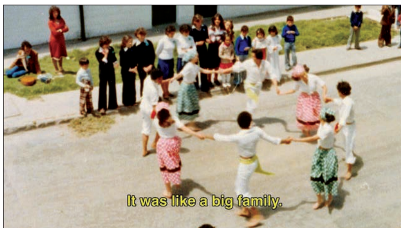
Fotograma de La Siberia : archivo de una celebración en La Siberia. 16

En una primera aproximación, se evidenció que hay varios elementos del documental que están expuestos a la “paradoja del inmemorial”. Por medio del uso de video y fotografía de archivo de antiguos habitantes, el documental apuesta a ser un puente que explora la memoria colectiva de este pueblo. Sin embargo, en la medida en que los eventos narrados y el uso de los archivos fotográficos privados de antiguos habitantes están soportados por una narrativa de un tono elegíaco, el uso de la narración y del archivo fotográfico es preponderantemente icónico. En efecto, apenas hay un par de vínculos indiciales entre eventos fácticos específicos y la narración o las imágenes de archivo mencionadas. En consecuencia, se podría estar invocando el inmemorial, según se argumentó antes.