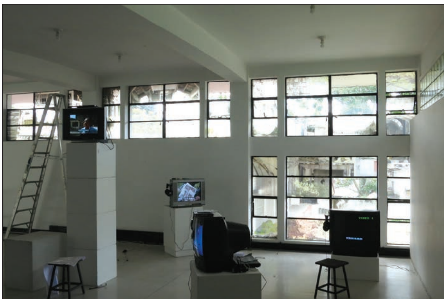
Pantallas que exhiben el material de archivo en la videoinstalación La Siberia: recuerda al olvidar .

A nivel autoetnográfico, la respectiva némesis del entusiasmo se manifestó especialmente en el proceso de edición que, en última instancia, implicaba constreñir los resultados de ese proceso obsesivo de registro a las restricciones del lenguaje documental: la fascinante y trágica alquimia de convertir 160 horas en los 86 minutos que hoy en día tiene La Siberia y, sobre todo, someterlas a las restricciones narrativas propias del medio, pues debíamos contar una historia linealmente. En forma paralela a la desilusión que experimentaban nuestros personajes con la ruina, el proceso de edición evidenció tensiones propias del documental como dispositivo de memoria: un relato solo se construye a partir de desechar y desechar restos audiovisuales.