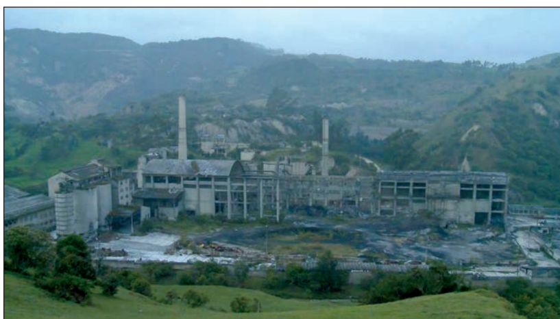
Fotograma de La Siberia : las ruinas al amanecer.

operación en 1934 con el fin de surtir cemento para la acelerada expansión urbana de la capital colombiana a mediados del siglo XX. Como mano de obra principal, incorporó a los habitantes del municipio, cuya población era preponderantemente rural. La Siberia conjugaba una urbanización del mismo nombre, donde vivían muchas familias de los antiguos trabajadores, incluyendo en sus instalaciones una escuela y un centro cultural. Por todo lo anterior, se constituyó en el eje de las actividades económicas de La Calera, así como de sus actividades culturales. Cerrada en 1998, entre otras, por causa de la obsolescencia tecnológica, la escasez de materia prima y los cambios en la estructura del mercado del cemento, hoy en día La Siberia es una monumental y escalofriante ruina. Lentamente carcomida entre sus grietas por el verde del campo que la circunda, el cemento derretido de su estructura aún evoca en forma inexplicable a Chernobyl.