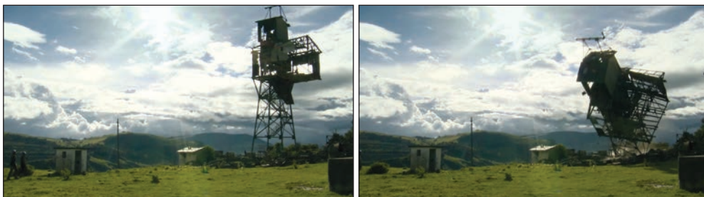
Fotogramas en secuencia de La Siberia : la caída de la torre más icónica en el cable que llevaba la caliza de la mina a la planta.

Asumida la urgencia de narrar el pasado, una presuposición básica a la luz de la previa realización del documental, las consecuencias de esa renuncia resultaban inconcebibles. Por otro lado, es posible interpretarlas en clave psicoanalítica para hacer visible la urgencia de buscar una salida a la amenaza de la iconoclasia. La posibilidad de narrar el pasado tiene un sentido de “duelo”, siguiendo a Bal et al. (1999). La paradoja de Lyotard se insinúa como amenaza, entonces, de todo proceso de “duelo”, tal como es analizado por Derrida (2001) cuando Lyotard advierte sin más: “No deberá haber duelo”. 10 La consecuencia de la iconoclasia, de este “aborto prematuro” de todo intento por narrar el pasado (La Capra 1994), podría ser comprendido a la luz del psicoanálisis, entonces, como “melancolía”.