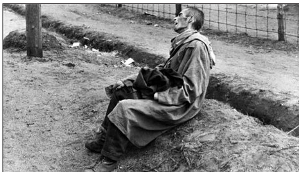
Imagen fotográfica del campo de concentración Bergen-Belsen.

Presentadas las tensiones que atraviesan la imagen fotográfica como representación del pasado en ese “caso extremo”, demos ahora una mirada breve al resto de signos que componen el lenguaje documental. Si como lo afirma David MacDougall, la representación fílmica es la “síntesis de varios modos de representación que remedan la representación mental” (MacDougall 1992), en los documentales históricos sucede que un arsenal de signos confabulan para crear la ficción de la presencia (Bruzzi 2000). En efecto, no solo se trata del uso de imágenes de archivo y la supuesta cualidad indicial mencionada antes: la voz en off y el uso de testigos y expertos pretenden crear la ilusión de la “absoluta presencia” (Barthes, citado en Lupton 2005) del pasado: el pasado ausente finge estar completamente a la mano, accesible para el espectador.