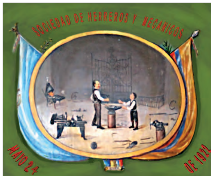
Blasones de los gremios de la Sociedad de Joyeros y de la Sociedad de Herreros y Mecánicos que formaban parte de la Sociedad Artística e Industrial de Pichinch (SAIP), preparados para los festejos del Primer Centenario de la Independencia, 1909-1930.