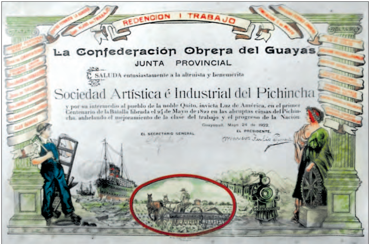
Pergamino de reconocimiento de la COG a la SAIP en la conmemoración del Centenario de la Independencia del Ecuador.