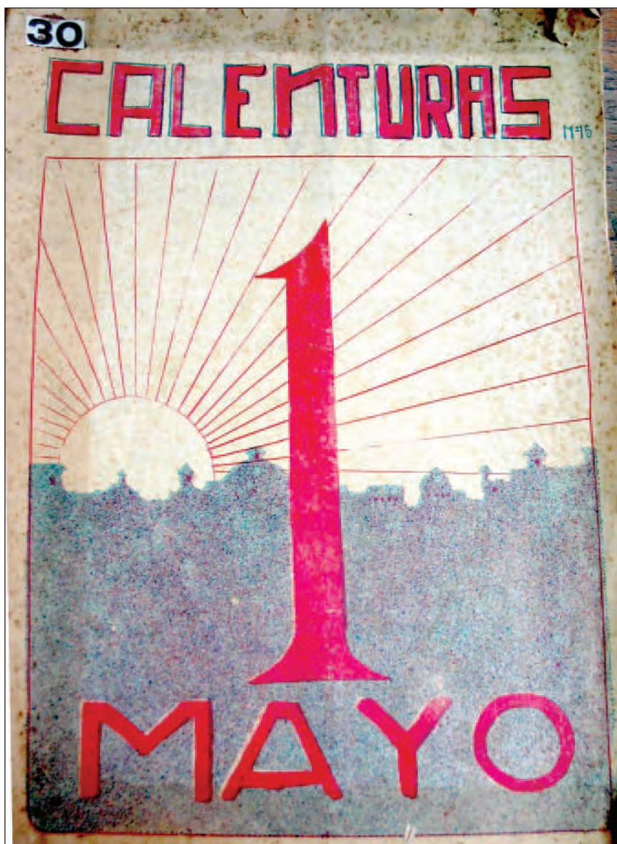
“Primero de Mayo” Revista Calenturas , 1923.