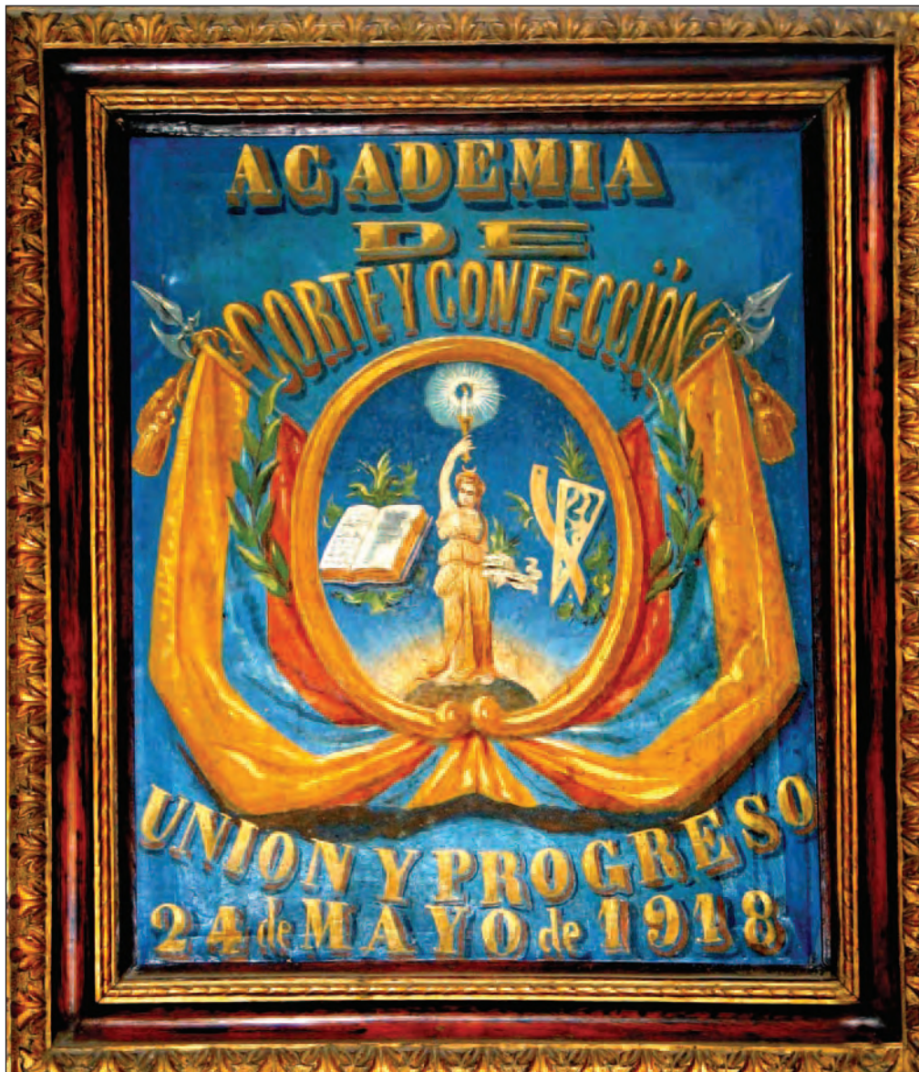
Blasón del gremio de la Academia de Corte y Confección que formaba parte de la Sociedad Artística e Industrial de Pichinch (SAIP), preparados para los festejos del Primer Centenarios de la Independencia, 1909-1930.