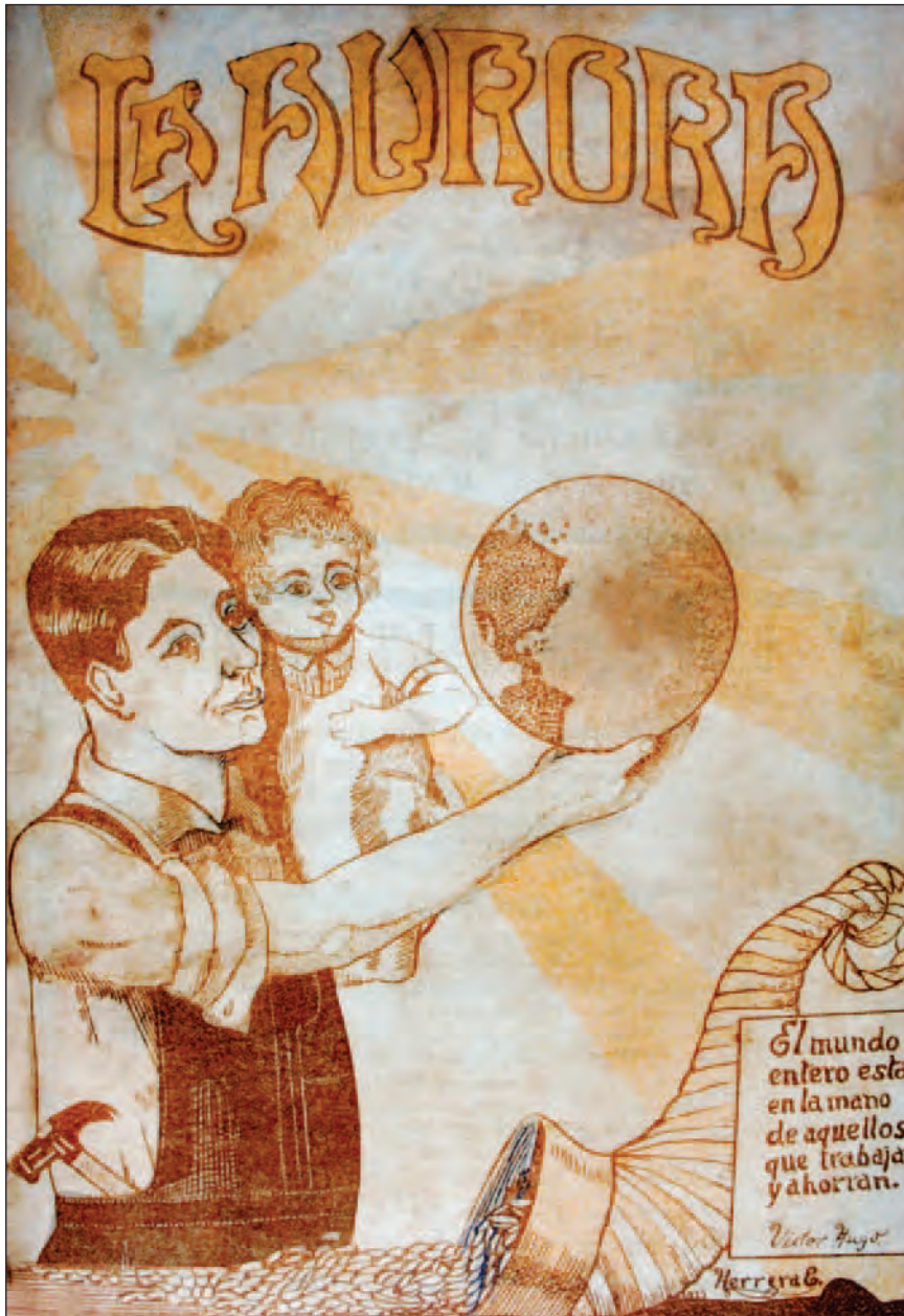
Portada revista La Aurora , N° 109. Guayaquil, septiembre 1927. Dibujo de Herrera.