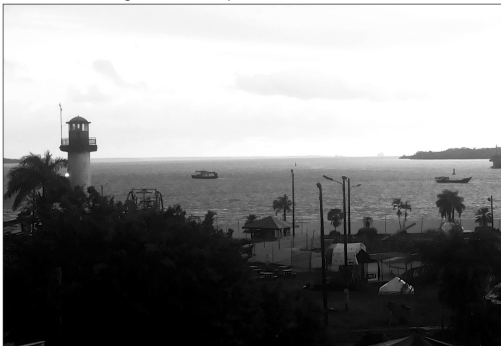
Imagen 5. La “ciudad puerto” evocada desde el lente

Siguiendo lo sugerido por el ensayista antillano Édouard Glissant (citado por Bojsen 2008), en el sentido de que naturaleza y poblaciones son “personajes activos de la historia”, consideramos que en el Pacífico sur y en Buenaventura se condensan, acontecen, fracturan y reinventan ambos personajes, paradójicamente, en medio de geografías violentadas y experiencias de reexistencia.