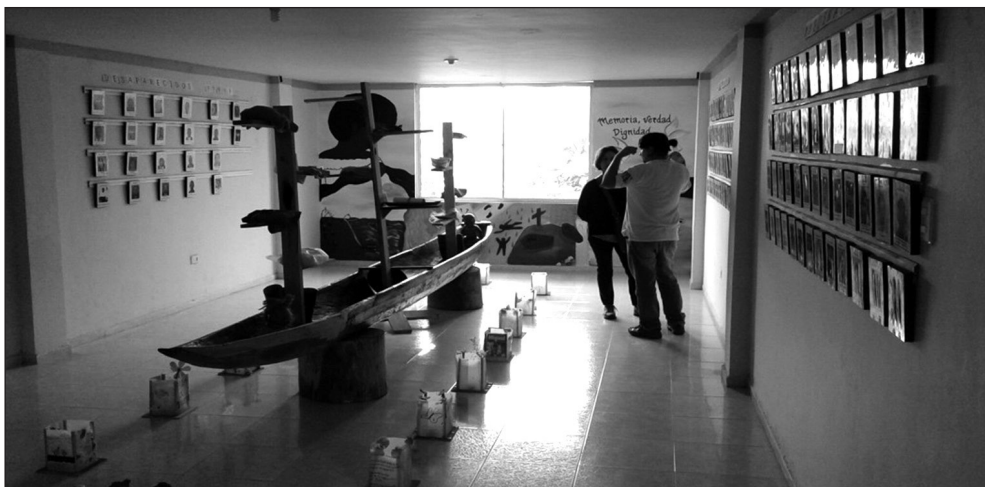
Imagen 7. La Capilla de la Memoria y el recuerdo transformador