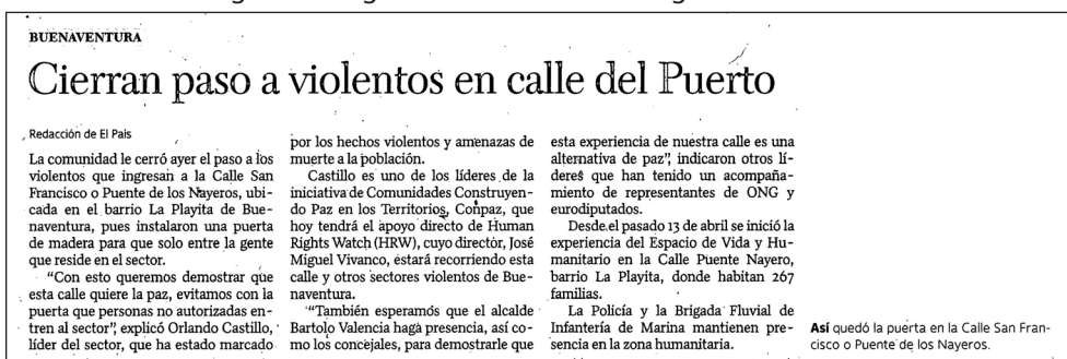
Imagen 4. Resignificando la calle desde gramáticas de vida

Hay una cosa aquí en el Pacífico y es que nosotros somos más orales... La lectura que nosotros hacemos [de la realidad local] la hacemos a través de la palabra, de las imágenes. El teatro es una herramienta que permite que esa costumbre se mantenga, o sea que yo te cuento, tú me cuentas y entre todos vamos reconstruyendo esa memoria y luego esa memoria otro la coge y la va contando también... Para esta parte de Colombia, es supremamente importante el tema del teatro, ¡el tema de la poesía sí!... El teatro nos permite estar allí con la gente y nos hace más sensibles frente a la situación que estamos viviendo (entrevista miembro del Semillero de Teatro por la Vida 2017).