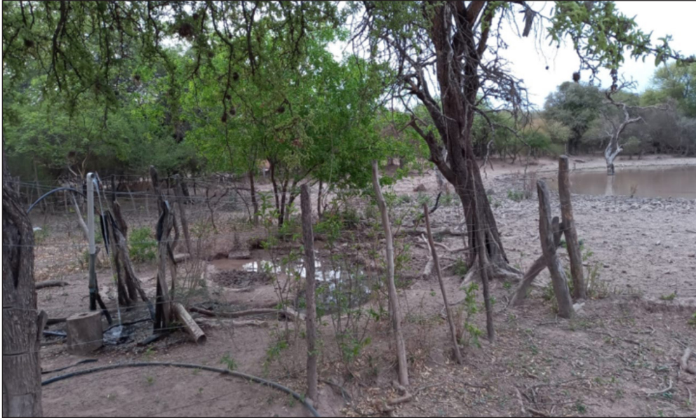
Figura 2. Pozo surgente y represa comunitaria en El Retiro