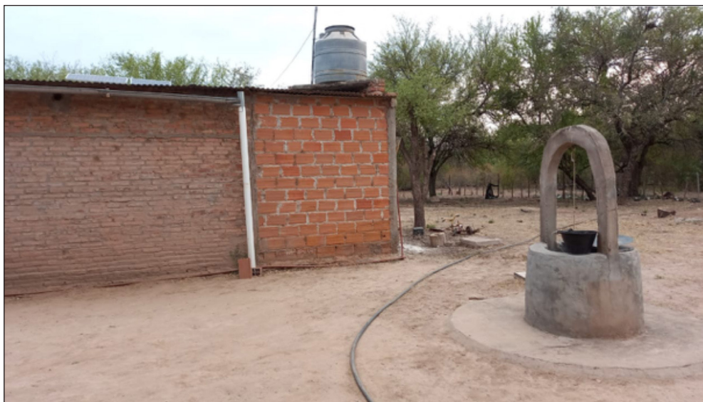
Figura 1. Aljibe familiar en la comunidad El Retiro