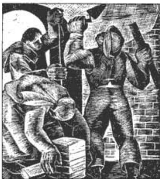
Portada: Albañiles, grabado de Eduardo Kingman