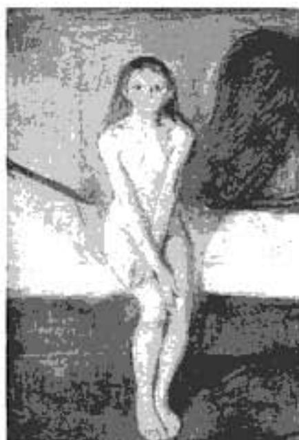
Portada: Pubertad , óleo de Edvard Munch