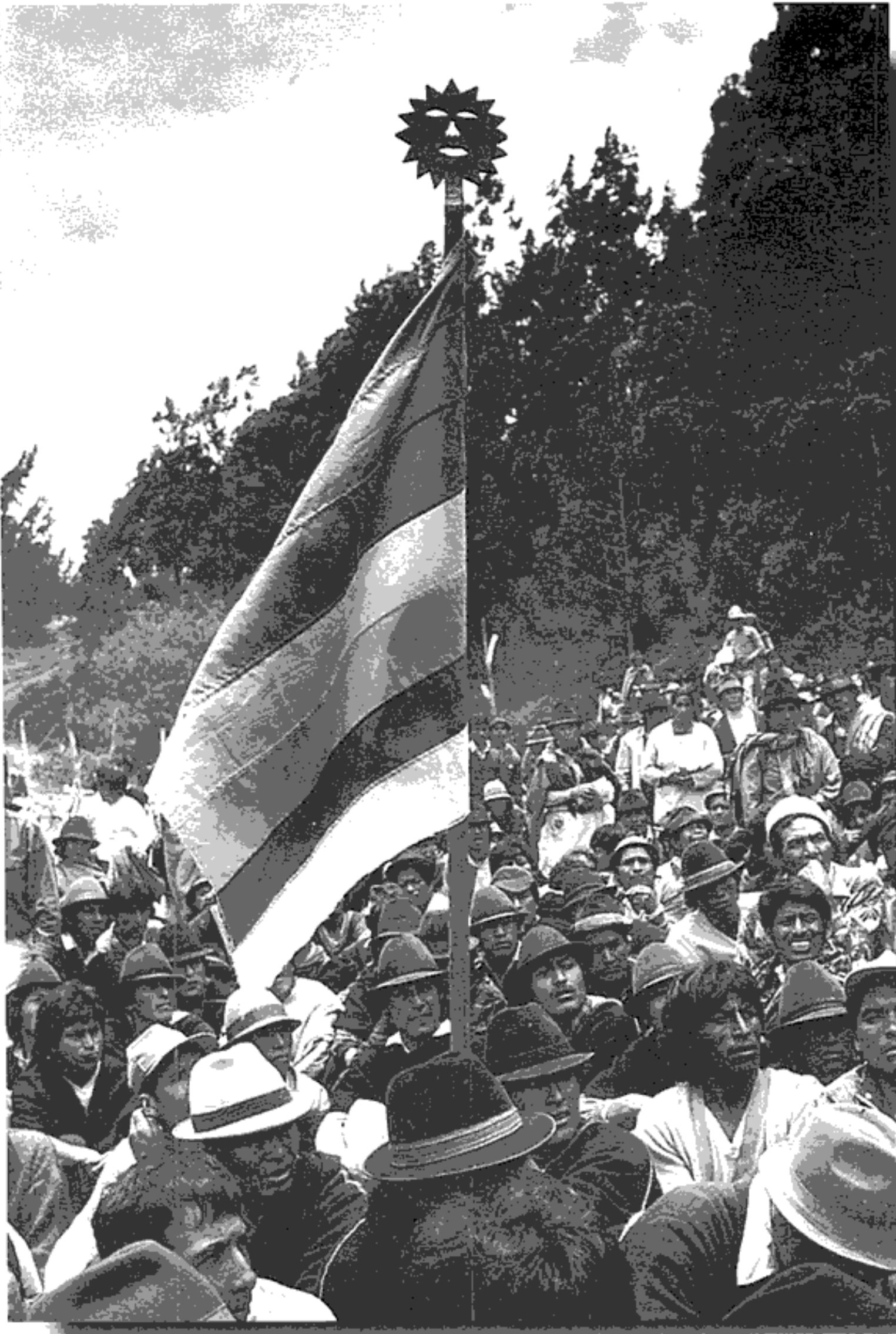
■ El movimiento indígena: el actor que conmovió a la nación y a la democracia

ser “abstracta” (fruto de un proceso de abstracción respecto a lo representado) para poder funcionar como instrumento de la acción sobre la sociedad, a partir de principios pragmáticos que puedan lograr efectos emancipados de los mundos de vida contingentes y concretos que se significan a través de ella. La lógica de los sistemas políticos y sociales modernos requiere de esa libertad de maniobra frente a lo concreto-práctico, frente a los mundos comunales de lo cotidiano y frente a las interacciones que se efectivizan en la co-presencia inmediata de los cuerpos (17) .